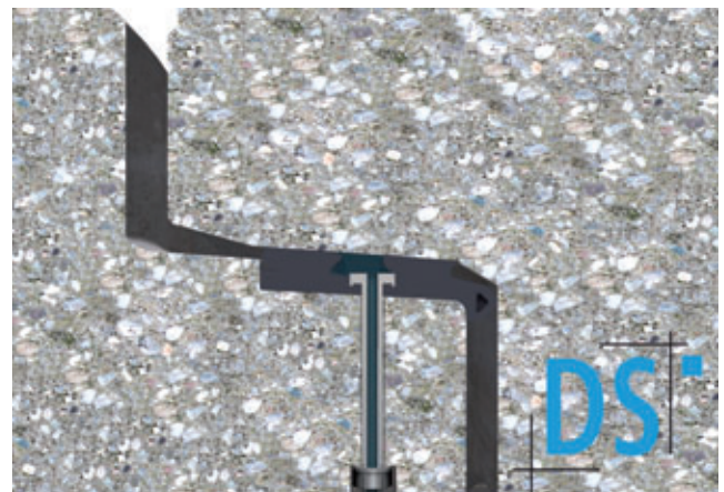
Dichtheitsprüfung mit Wasser