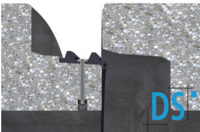
DS PDK vor der Montage

DS Dichtungstechnik GmbH Lise-Meitner-Str. 1 48301 Nottuln, Deutschland T +49 2502 23070 F +49 2502 230730 info@dsseals.com www.dsseals.com